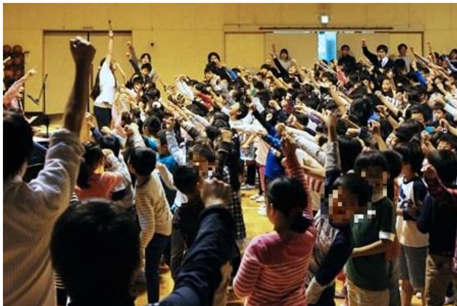
「大田区学校出張コンサート」